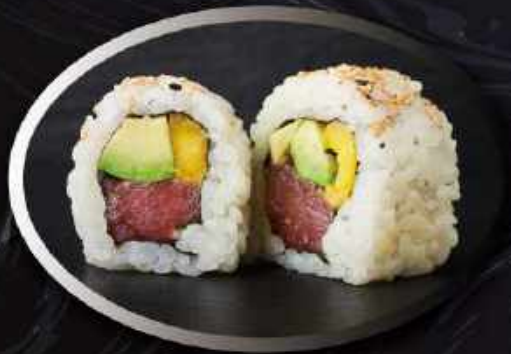
U4. Mango tuna (8 stk.) ..... 85,00kr. Tuna, avocado, mango