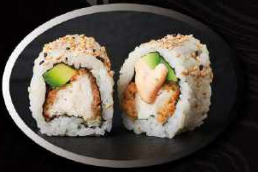
U7. Crispy kylling (8 stk.) ..... 85,00kr. Indbagte kylling, avocado, spicy mayo