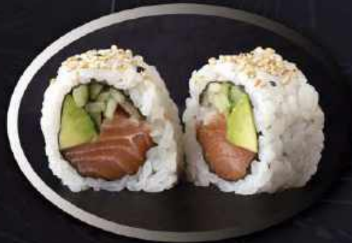
U2. Laks (8 stk.) ..... 85,00kr. Laks, agurk, avocado.