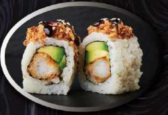
U23. Stegløg roll (8 stk.) ..... 100,00kr.

Avocado, tofu, agurk, peanut butter toppet med peanuts.