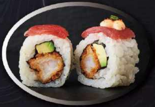
U17. Tun deluxe (8 stk.) ..... 130,00kr.

Tempura rejer, avocado toppet med tun, spicy mayo, chilipulver