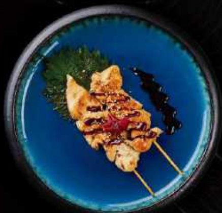
S9. Oksesticks (2 stk.)