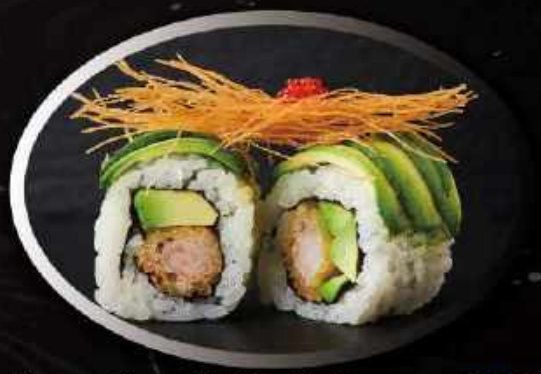
U20. Avocado roll (8 stk.) ..... 130,00kr.

Tempura rejer, avocado toppet med grillet tun, teriyaki, spicy mayo og sesam.