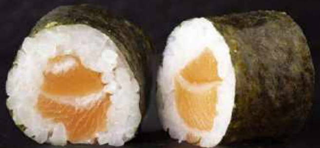
H2. Laks (8 stk.)