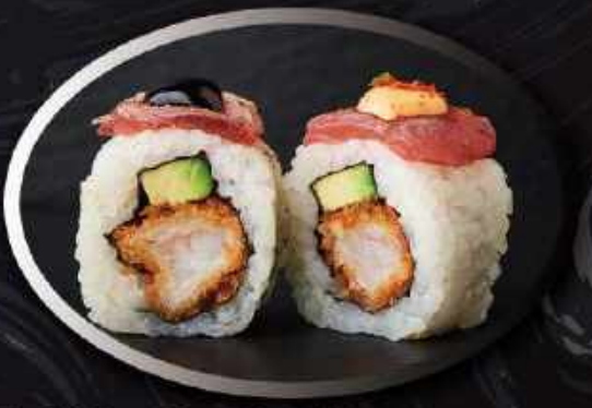
U19. Grillet Tun (8 stk.) ..... 130,00kr.

Tempura rejer, avocado toppet med grillet laks, spicy mayo, teriyaki, sesam