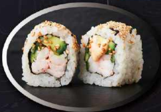
U9. Super chili shrimp (8 stk.) ..... 85,00kr. Rejer, avocado, agurk, spicy mayo, Kimchi seasam