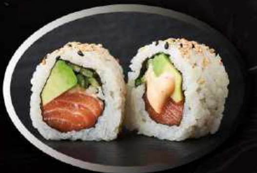
U3. Spicy laks (8 stk.) ..... 85,00kr. Laks, agurk, avocado, spicy mayo