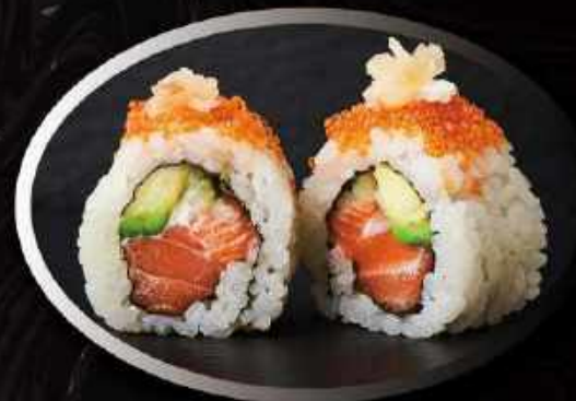
U14. New York (8 stk.) ..... 95,00kr. Laks, hvidløg, cream cheese, agurk toppet med tobikko og hvidløg