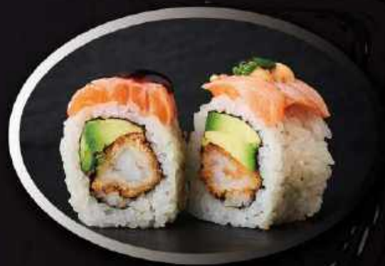
U18. Grillet laks (8 stk.) ..... 125,00kr.

Tempura rejer, avocado toppet med tun, spicy mayo, chilipulver