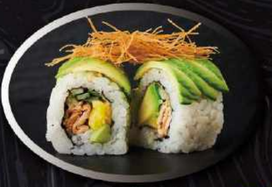
U21. Vegetar roll (8 stk.) ..... 120,00kr.

Tempura rejer, avocado toppet med spicy mayo, avocado, teriyaki, katafi, tobikko og sesam.