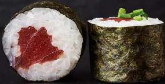
H7. Tun m. purløg (8 stk.)