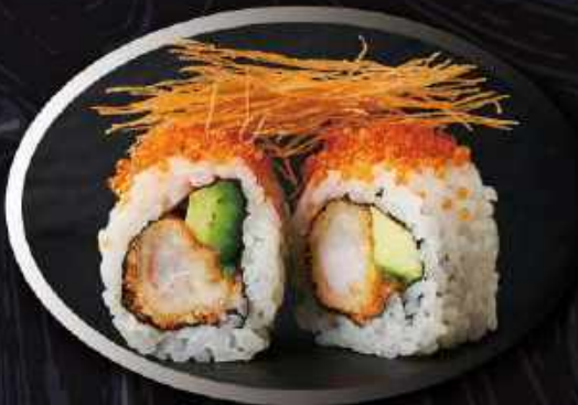
U13. Ebi tempura (8 stk.) ..... 90,00kr. Tempura rejer, avocado, toppet med tobikko orange og kataifi.