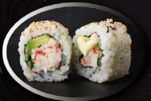
U1. California (8 stk.) ..... 80,00kr. Agurk, avocado, Surumi, mayo