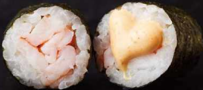
H9. Spicy rejer (8 stk.)