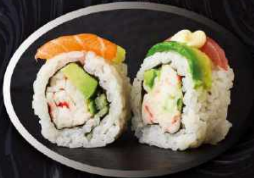
U15. Rainbow (8 stk.) ..... 120,00kr. Surimi med mayo, agurk, avocado toppet med laks, tun rejer, avocado og Japansk mayo.