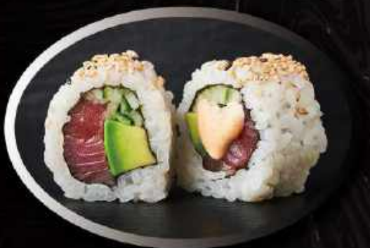
U5. Spicy tuna (8 stk.) ..... 85,00kr. Tuna, agurk, avocado, spicy mayo