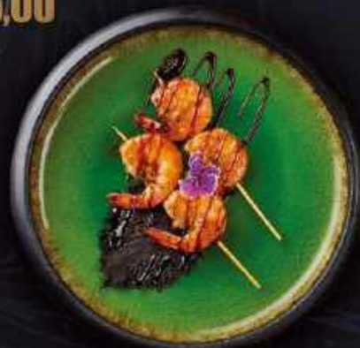
S5. Tiger rejesticks (2 stk.)