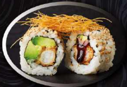
U8. Crispy ebi (8 stk.) ..... 85,00kr. Tempura rejer, spicy mayo, avocado toppet med kataifi teriyaki og sesam.