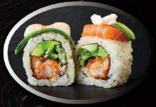
U24. Ebi Rainbow roll (8 stk.) ..... 125,00kr.

Tempura rejer, avocado, spicy mayo, toppet med stegt løg, teriyaki og sesam