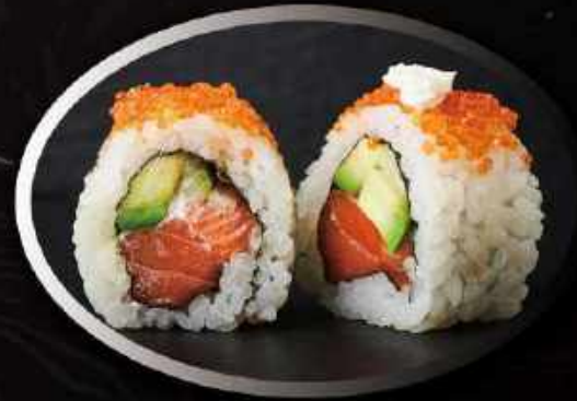
U12. Alaska Uramaki (8 stk.) ..... 90,00kr. Laks, agurk, avocado og flødeost toppet med tobikko.