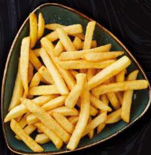
V18. Pommes frites Serveret med ketchup.