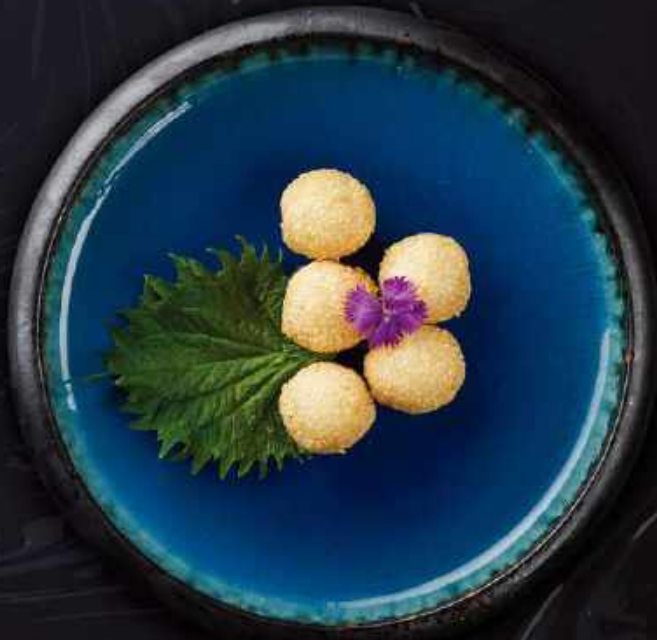
V16. Sesame ball (5 stk.)