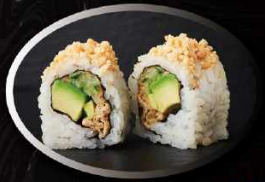
U22. Peanuts roll ..... 85,00kr.

Mango, tofu, agurk, peanut butter toppet med avocado og kataifi.