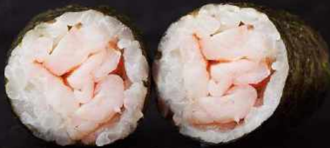
H8. Rejer (8 stk.)