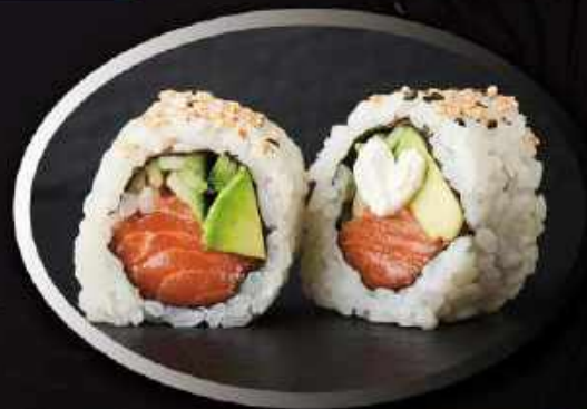
U10. Philadelphia (8 stk.) ..... 85,00kr. Laks, agurk, avocado, flødeost