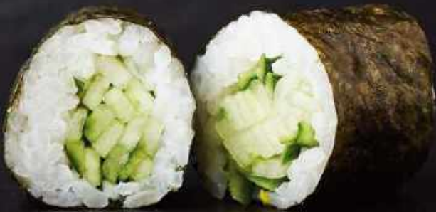
H1. Agurk (8 stk.)