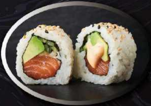
U11. King's maki (8 stk.) ..... 90,00kr. Laks, asparges, avocado, spicy mayo, agurk.