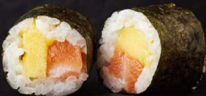
H10. Laks med mango