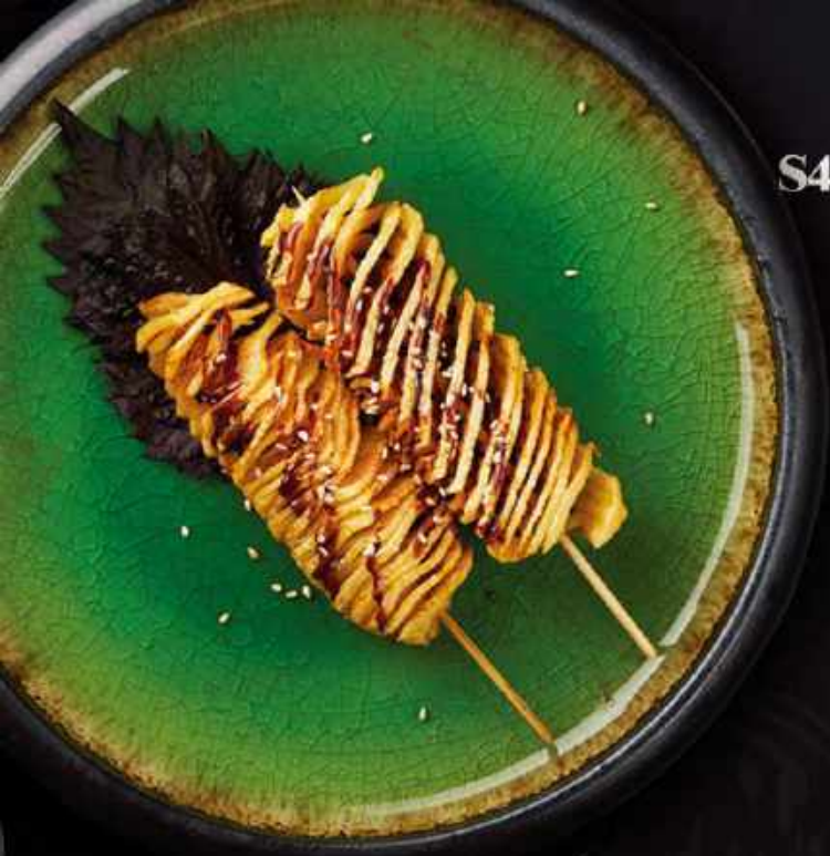
S4. Kartoffel sticks (2 stk.)