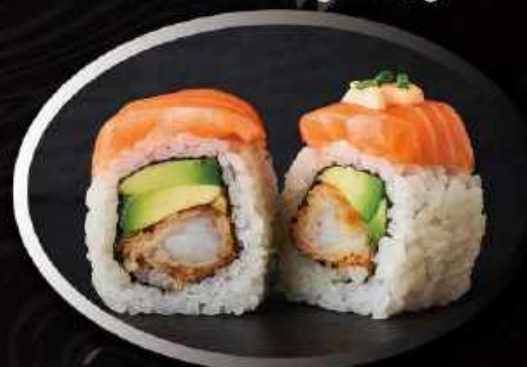
U16. Laks deluxe (8 stk.) ..... 125,00kr. Tempura rejer, avocado toppet med laks, spicy mayo og sesam