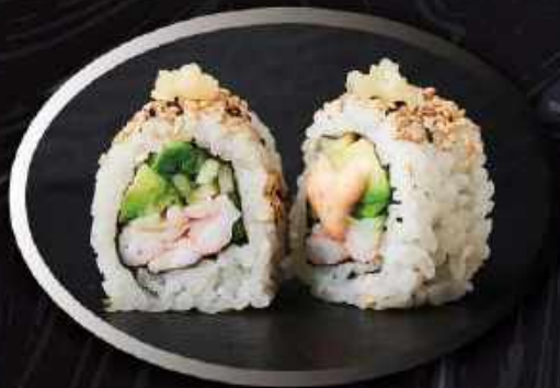
U6. Spicy reje (8stk.) ..... 85,00kr. Rejer, agurk, avocado, spicy mayo, hvidløg.